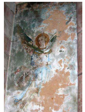
Cette fresque représentant un ange se situe sur le mur au-dessus des fonts baptismaux.