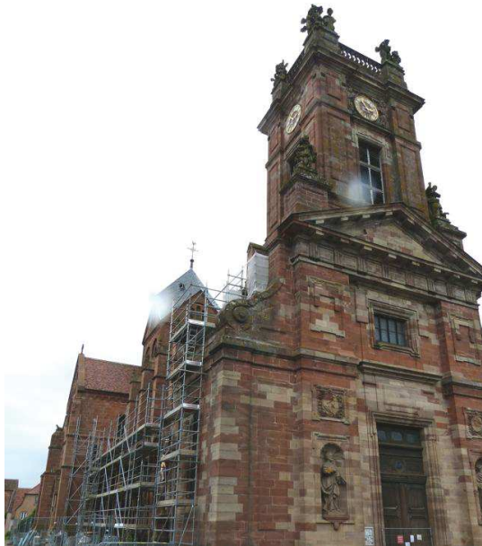
Menacée par des infiltrations d'eau, l'abbatale fait l'objet d'un chantier de restauration des extérieurs et des intérieurs.

Oui mais voilà, l'abbatale a subi les affres du temps. « Nous avons dû faire face à des problèmes d'infiltrations qui ont dégradé les murs et les vitraux », note Rémy Gerling, président du conseil de fabrique. Depuis le printemps 2014, l'édifice fait donc l'objet d'un chantier de restauration des extérieurs et des intérieurs (DNA du 19/09/2014). Les travaux concernent l'étanchéité du toit et des vitraux ainsi que leur nettoyage, mais aussi la réalisation d'une barrière étanche de la partie basse des façades. « Un système d'étanchéification a été mis en place afin que l'eau ne remonte pas par le sol », traduit Rémy Gerling. En parallèle, des travaux de restauration des décors peints, endommagés par les infiltrations, ont été entrepris. Le chantier a été réalisé en deux temps : d'abord le transept et le chœur, durant deux ans, puis, la nef. « Là, c'est la phase finale. Normalement, les travaux des extérieurs devraient être terminés pour la mi-août. Quant à la restauration des intérieurs, elles devraient se poursuivre encore durant quelques semaines, un voire deux mois », espère Daniel Burrus. Pour mener à bien ce chantier, il a été fait appel à l'architecte en chef des monuments historiques, Pierre-Yves Caillaud, en charge notamment des travaux concernant la cathédrale de Strasbourg. Propriété de