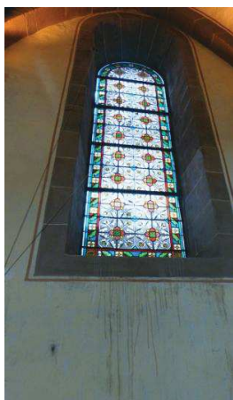
Les infiltrations d'eau de pluie mais aussi la condensation ont fait de gros dégâts avec le temps.

Saverne. Pour tout renseignement et contribution, s'adresser à la mairie de Neuwiller-lès-Saverne, rue du Général-Koenig, 03 88 70 00 18.