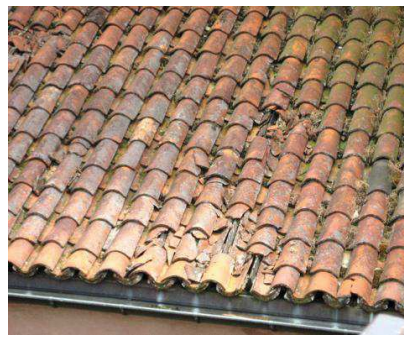
La toiture de la chapelle Saint-Sébastien dont certaines tuiles canal sont aujourd'hui en mauvais état.

Pendant, les travaux, les membres du conseil de fabrique ont profité de la présence des échafaudages pour changer l'éclairage. Les bénévoles ont ainsi installé 260 nou-