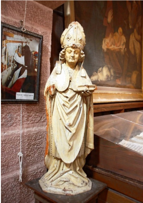
Très abîmée, la statue en bois de saint Adelphus, datant du XVI e siècle, est classée au titre des Monuments historiques depuis 1996.