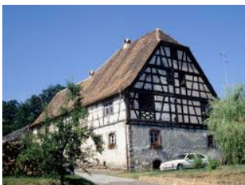
Wimmenau [ Alsace ]