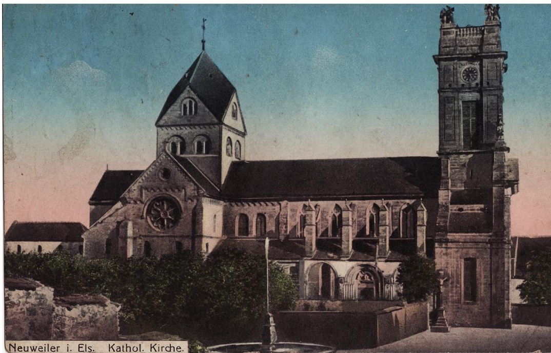
Carte postale (vers 1919)